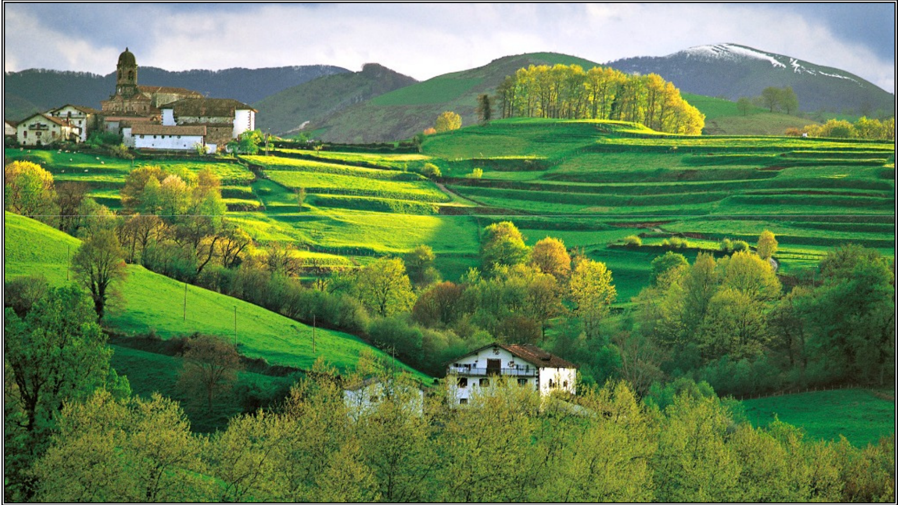
Ziga (Valle de Baztán)