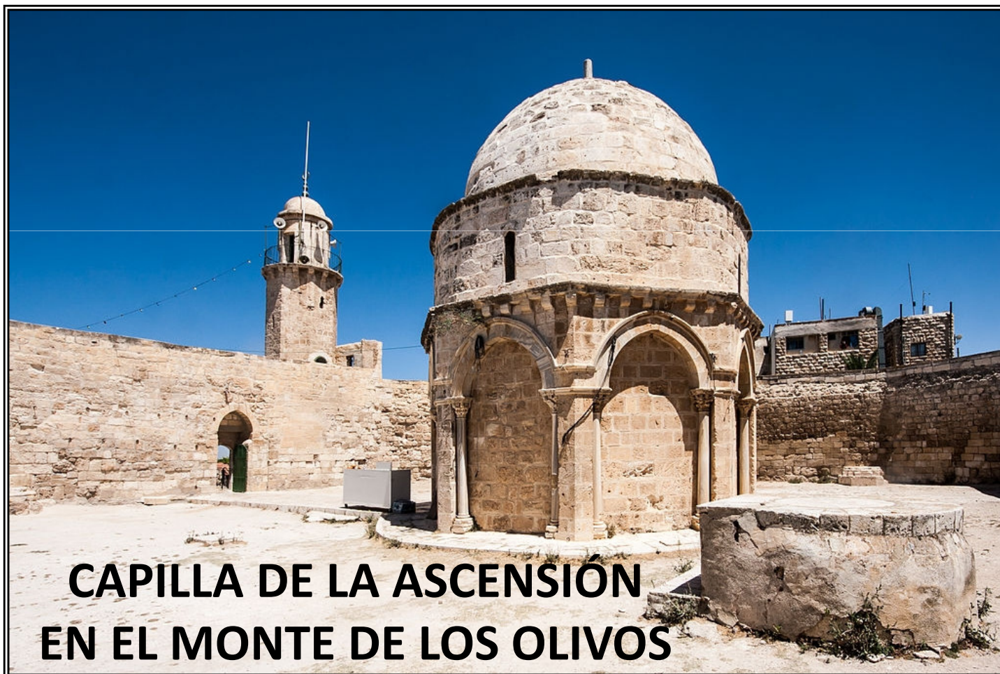
CAPILLA DE LA ASCENSIÓN EN EL MONTE DE LOS OLIVOS